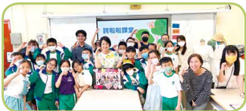
兩位外國教育工作者到訪，分享創意教學心得。