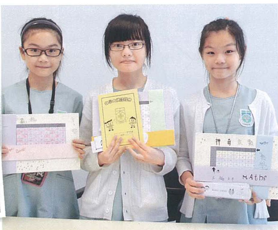
六年級學生擔任「數學大使」，自製教材教導學弟學妹。