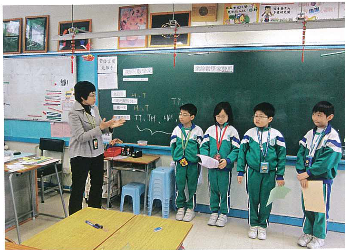
教師以「課堂面批」，給予學生即時回饋。

除了傳統的總結性評估外，我們亦有採用多樣化的進展性評估設計，以照顧不同學習風格的學生。如一至四年級的「闖關活動」，利用綜合性的攤位活動，在愉快的氣氛下完成相關的數學學習。另外，還有「課堂面批」，教師利用分組活動及課堂總結前的面批活動，觀察學生的學習進度及進程，並作即時的回饋。