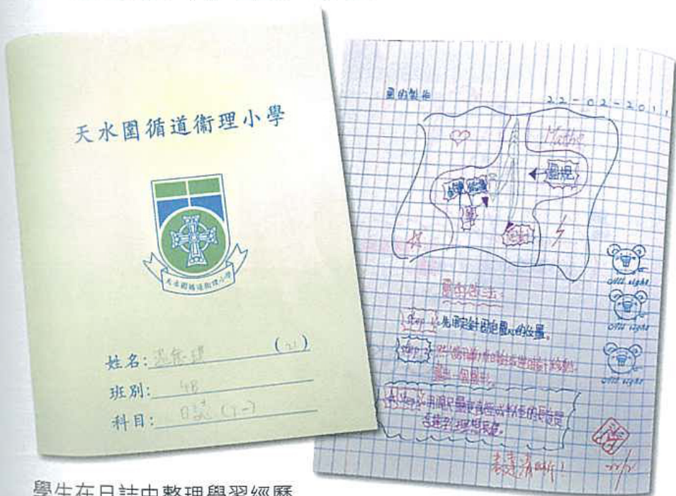
學生在日誌中整理學習經歷

寫日誌的目的是培養學生在課堂學習的過程中，進行自我學習歷程的整理。要不斷將聽取的內容加以思索，經過吸收、理解、消化、記憶後，終能成為自己的思想產物，真正達到「作學問」的真諦。