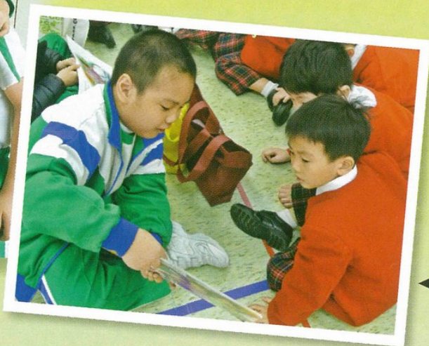
◀二年級學生為幼稚園學生講故事