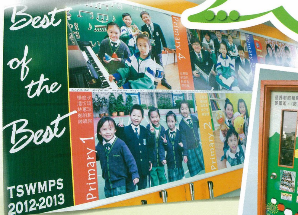
▲學校把優秀學生的相片貼在牆壁上

作為教育工作者，從不計較外界對天水圍這個社區的標籤；他們都有一個共同的信念，就是教好每一個學生。天水圍循道衛理小學五位教師同心做好培育工作，合力為學生建立一個溫暖的「家」，期望學生長大後，成為健康的良好公民，努力服務及貢獻社會。