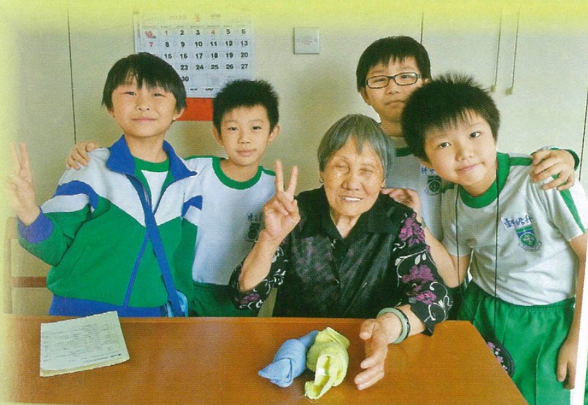
▲三年級學生探訪長者中心

梁老師說：「不少家長從來未曾到過新加坡，當小朋友知道自己即將踏足一個連父母也未去過的國家，就會更加珍惜這次機會。由於全級學生參與，需要動員很多老師隨團照顧，值得我們高興的是，不少家長義工樂意自費參加，協助老師分擔工作。」