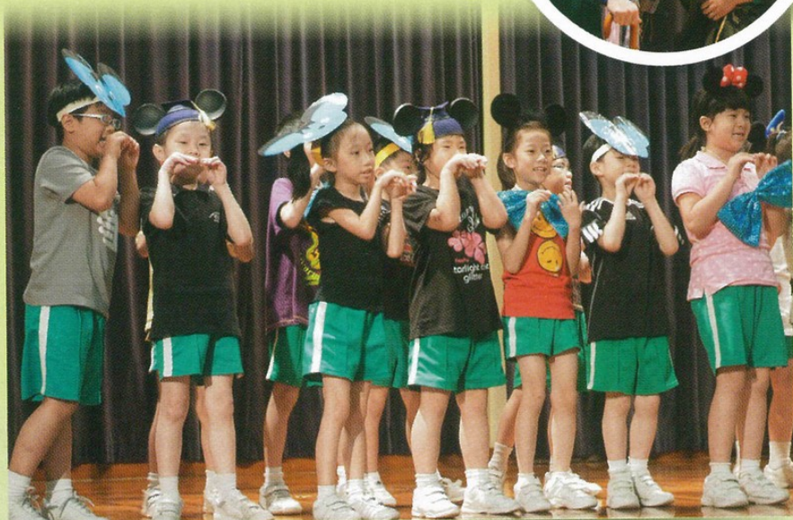
▲ 多元化學習活動，培養學生的全人發展。