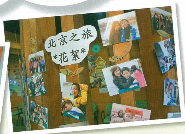
▲六年級「北京文化之旅」相片張貼在校園，讓全校師生分享旅程點滴。