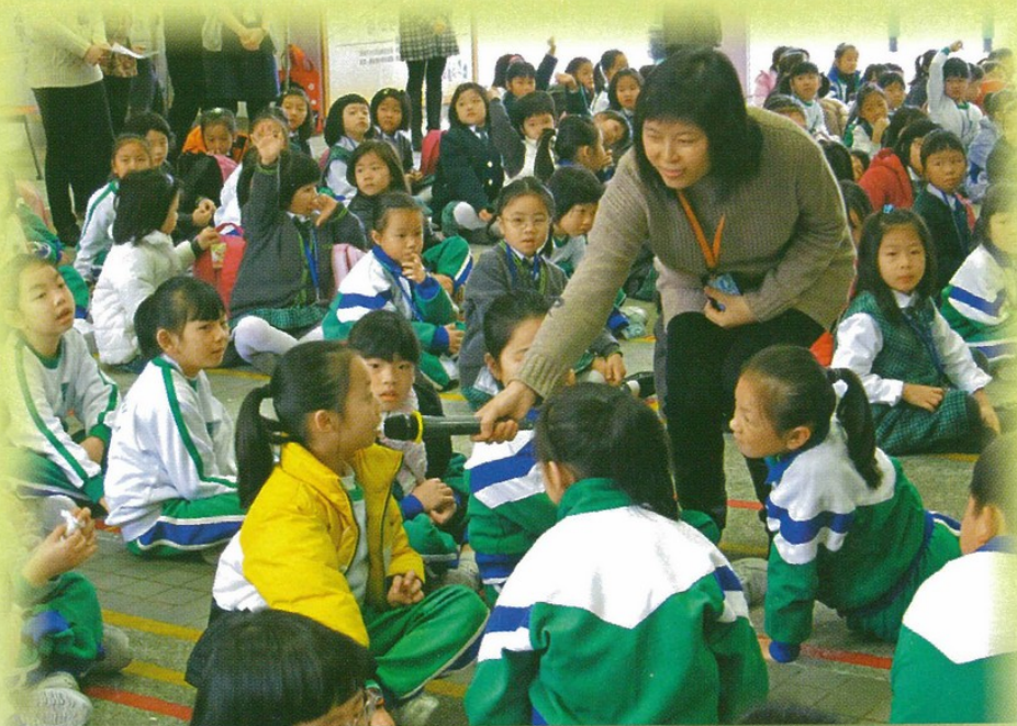
▲教師讓學生充分表達意見，啟發思考。

整體而言，小組教師從策劃至實踐等不同層面，以出色的規劃、多元化的策略，推動課程與資源的整合，落實學校「教訓輔合一」的培育學生理念，建構關愛文化，發揮團隊精神，推動「全校參與」。他們掌握學生的成長需要，能有效培養學生正面價值觀；學生能充分表達意見，啟發思考，發揮潛能。此外，教師的反思能力極強，經常檢討教學成效，持續優化學生培育工作，推動教師培訓，為學校建立學習型的團隊。他們積極促進家校合作，獲得家長高度的讚賞，誠為一支卓越的教師團隊。