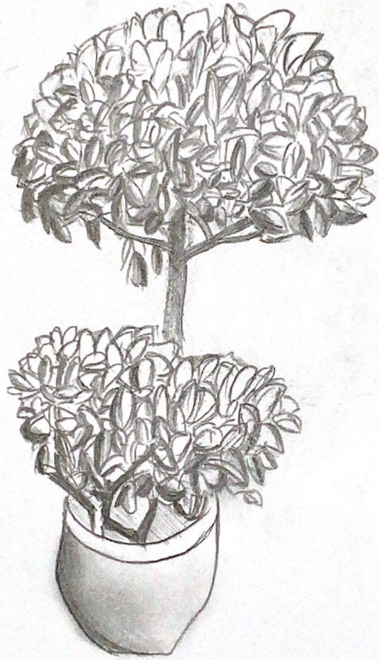
5D 曾鎂晴 素描（樹）