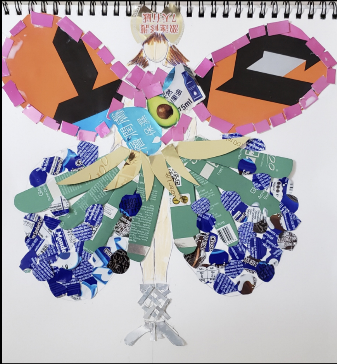
5A 陳諾行 精靈媽媽的 服裝設計