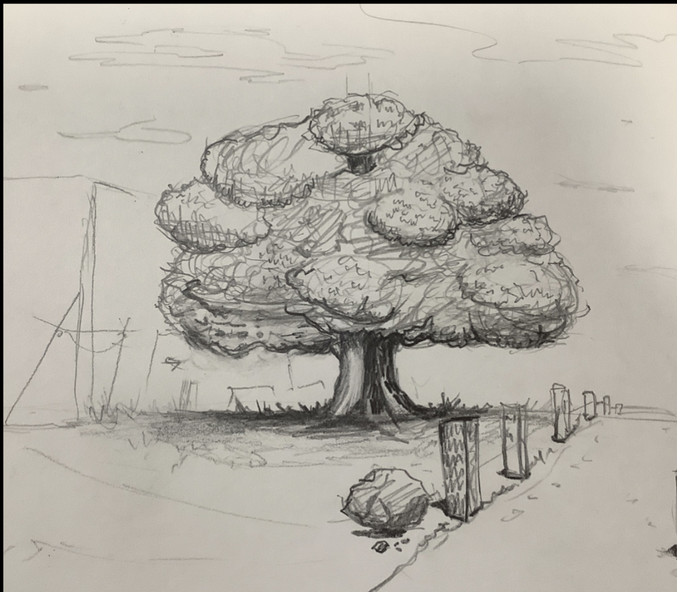
5B 譚熹蔓 素描（樹）